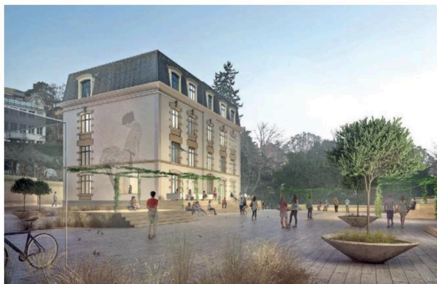
Illustration de la future auberge de jeunesse. IMAGES DE SYNTHÈSE : ANDREA PELATI ARCHITECTE

La transformation du collège en auberge de jeunesse redonnera vie à un bâtiment emblématique datant de 1897 tout en valorisant les éléments historiques. Le projet architectural