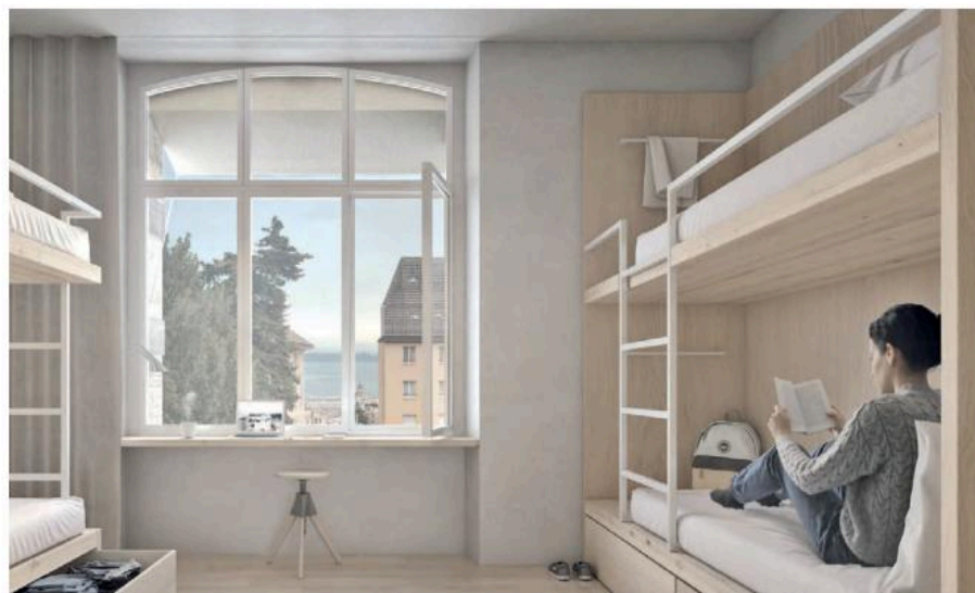
Illustration d'une chambre dans la future auberge de jeunesse.

Grâce à une offre de chambres doubles, familiales, à 4 ou 6 lits, la nouvelle auberge s'adresse aussi bien aux familles, aux touristes en solo ou en groupe et même aux classes d'école. Idéalement située entre le lac, la vieille ville et la gare, elle renforcera le tourisme urbain et éducatif à Neuchâtel, tout en complétant le réseau des Auberges de Jeunesse Suisses en Suisse romande. «Avec l'auberge de jeunesse de Neuchâtel, nous ne créons pas simplement un hébergement, mais un lieu de rencontre vivant pour des personnes venues du monde entier. Dans ce bâtiment historique, nous faisons naître une offre contemporaine, abordable et accueillante, au cœur de la ville, bien connectée et ouverte aux voyageurs de tous âges. Nous allons patrimoine, fonctionnalité et durabilité pour créer un endroit où l'on aime arriver... et revenir», explique Janine Bunte, CEO des AJS. ● so